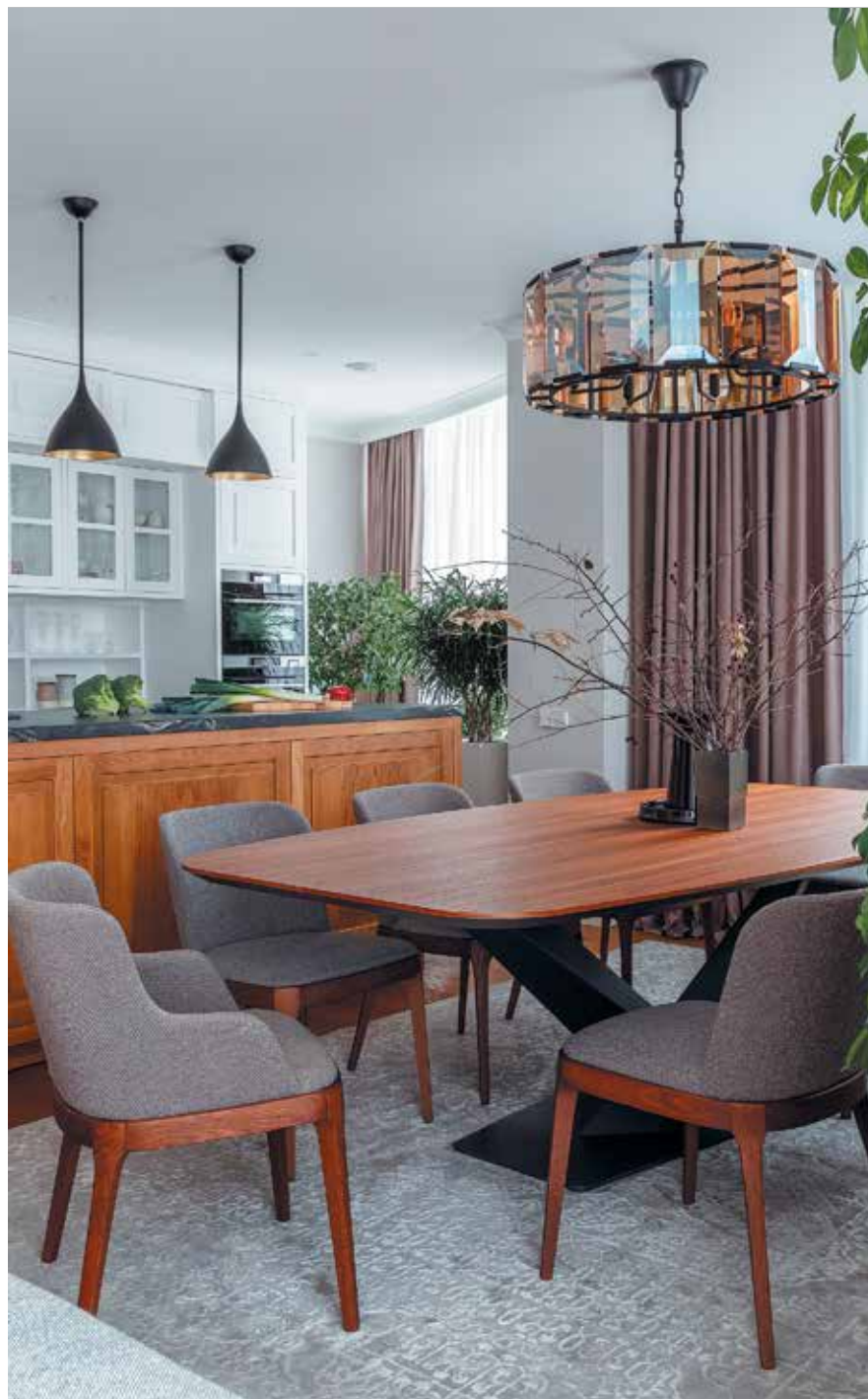
Кухня-столовая. Обеденная группа: стол, стулья, барные стулья – Cattelan Italia, кухонный гарнитур выполнен на заказ по эскизам бюро Chado

Основной прием оформления – соединение современных материалов и мебели с классической отделкой