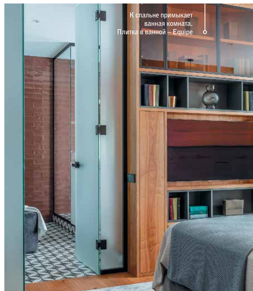
К спальне примыкает ванная комната. Плитка в ванной – Equire

В бюро Chado вспоминают: «Очень редко бывает так, что заказчики делают все согласно 3D-визуализациям и следуют рекомендациям дизайнеров. Здесь же работать было легко и приятно – клиенты полностью придерживались наших идей. Результат максимально приближен к тому, что мы задумали». ■