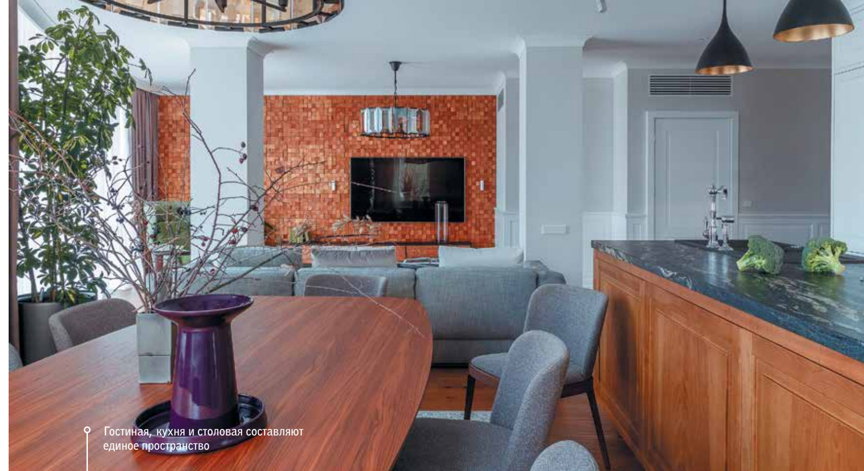
Гостиная, кухня и столовая составляют единое пространство

Дерево – основной материал в этом проекте: его цвета и фактуры вносят ощущение теплоты и уюта