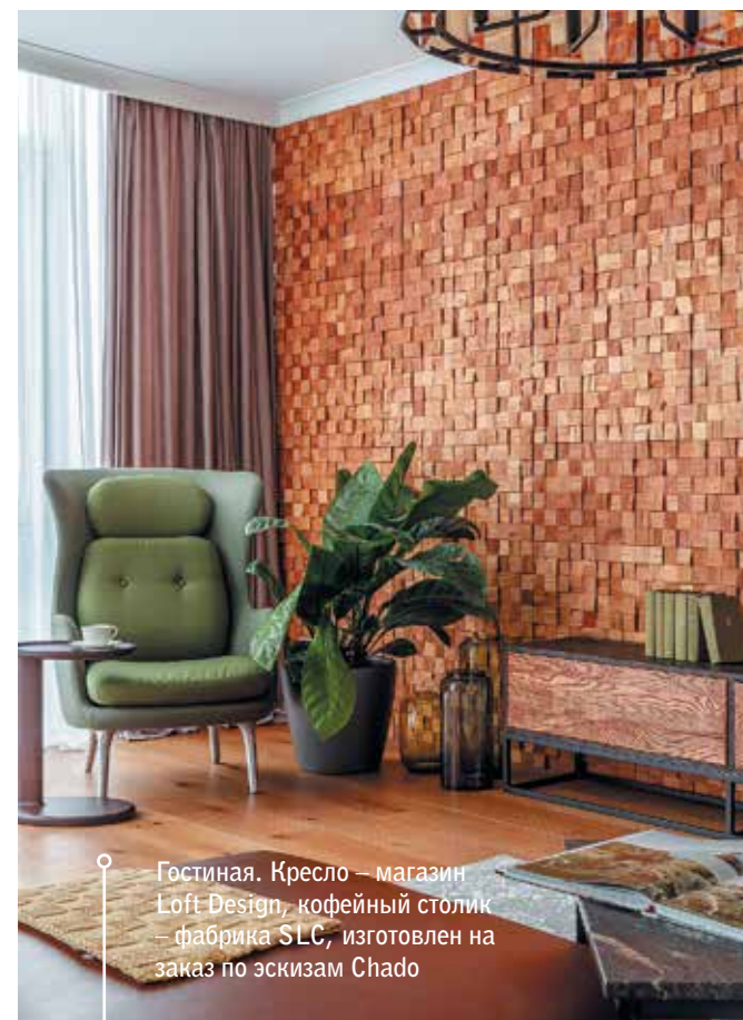
Гостиная. Кресло – магазин Loft Design, кофейный столик – фабрика SLC, изготовлен на заказ по эскизам Chado

Дерево – основной материал в этом проекте: его цвета и фактуры вносят ощущение теплоты и уюта