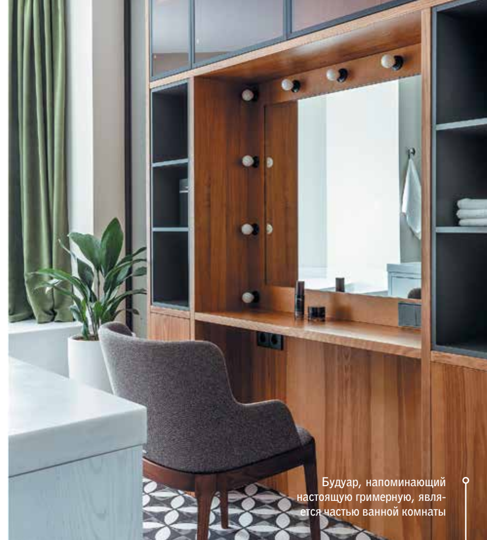
Будуар, напоминающий настоящую гримерную, является частью ванной комнаты