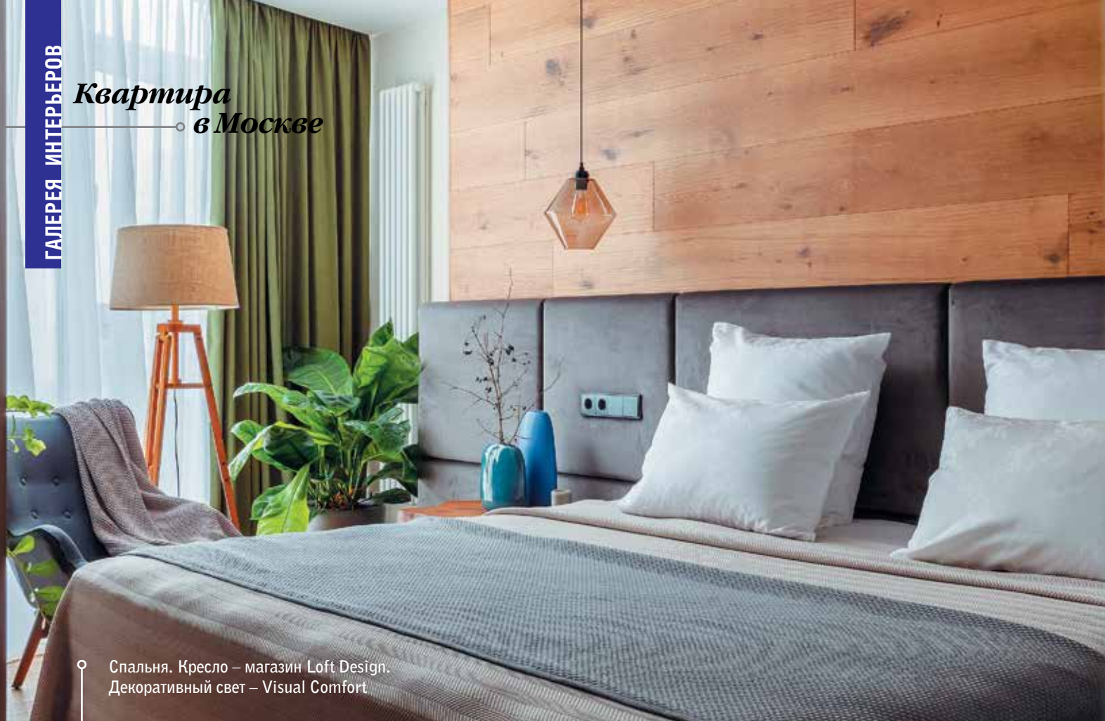
Спальня. Кресло – магазин Loft Design. Декоративный свет – Visual Comfort