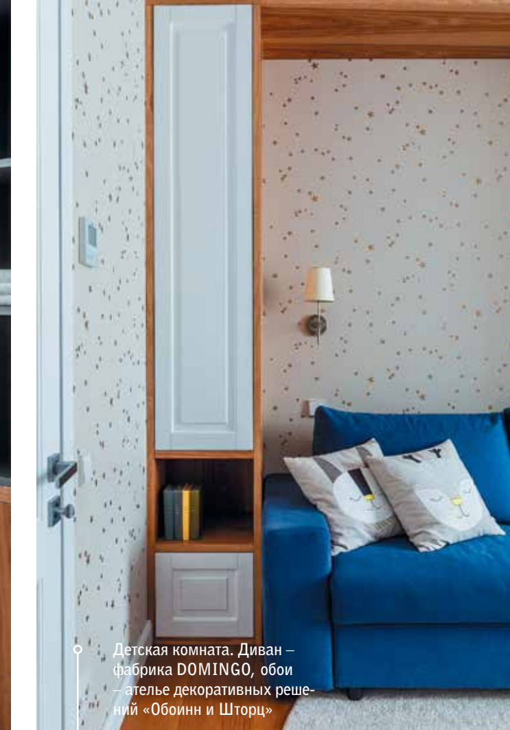
Детская комната. Диван – фабрика DOMINGO, обои – ателье декоративных решений «Обоинн и Шторц»

Кухня, как и вся корпусная мебель в квартире, изготовлена на заказ специально для этого проекта. Фасады гарнитура согласуются с декором нижней части стен. Столешницу решили сделать из натурального камня, однако из-за крупного размера в лифт она не поместилась. И выход (вернее, вход для нее) был придуман необычный: столешницу доставили через окно с помощью подъемного крана.