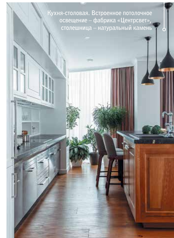
Кухня-столовая. Встроенное потолочное освещение – фабрика «Центрсвет», столешница – натуральный камень